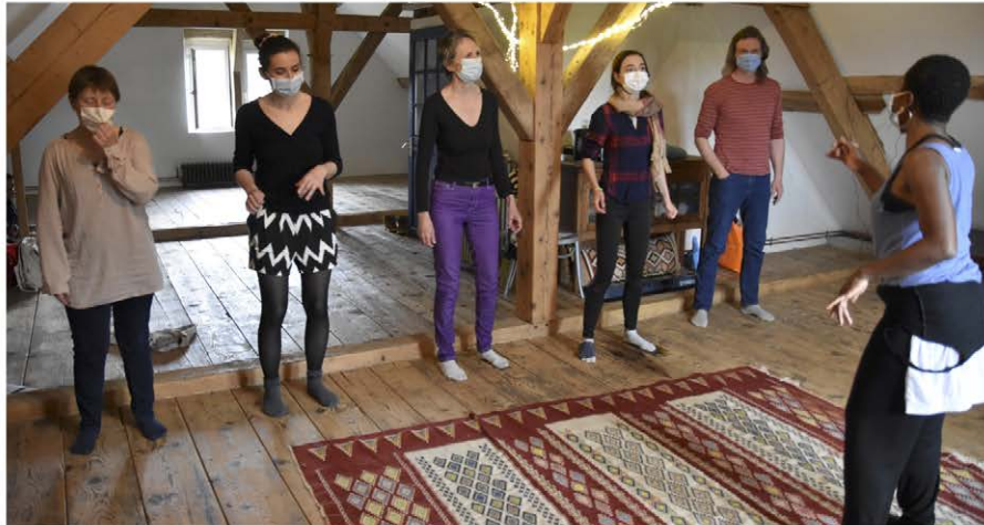
Des artistes du monde entier vont donner des cours de musique

Même si Ceremusa a été créé en 2015, son envol a enfin pris en 2020, grâce, n'ayant pas peur de le dire, au confinement. « Avant, avec