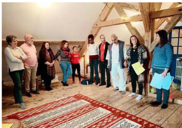
Pour la première fois depuis sa création, Ceremusa a ouvert ses portes aux visiteurs venus nombreux.